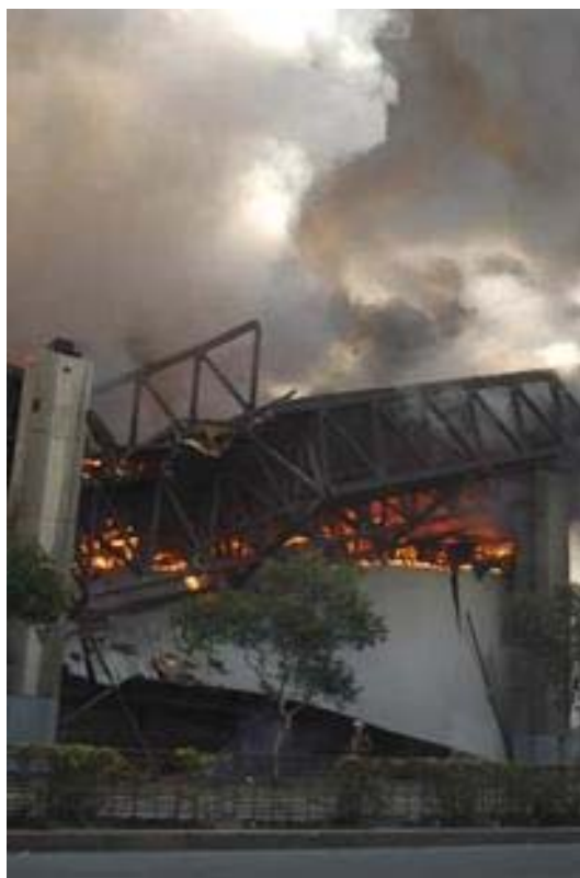
Imagen de archivo. Incendio de la placa del conjunto en marzo del 2006.

El alto valor de las obras existentes en ambas colecciones permite realizar una gestión internacional que retoma el espíritu original del proyecto y que asegura la conservación de este patrimonio mundial. Dado este objetivo, se encontrarían interesados los respectivos organismos dedicados a la conservación del arte, pertenecientes a los gobiernos de los países donde originalmente fueron producidas estas obras. Esto se ve acentuado por el hecho que éstas se encuentran en este momento en un estado de conservación y exposición degradadas para la importancia cultural internacional que presentan.