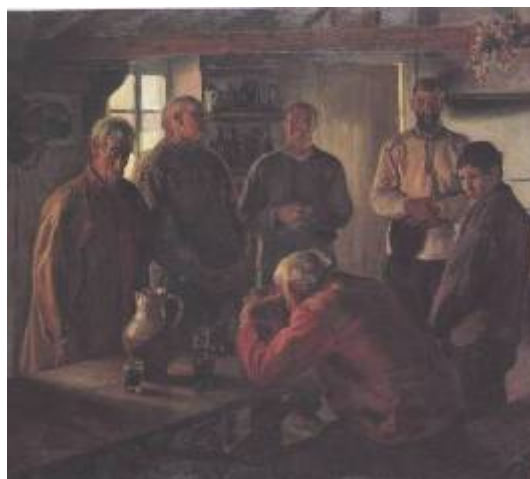
Eduardo Chicharro y Agüera, 190?. El Angelus . Colección Museo Nacional de Bellas Artes.

La importancia de contar con espacios de conservación adecuados para estas 2 colecciones, radica en que éstas colecciones presentan una serie de piezas de calidad internacional excepcional que las sitúa por sí solas, y en conjunto, en el rango de patrimonio de la humanidad.