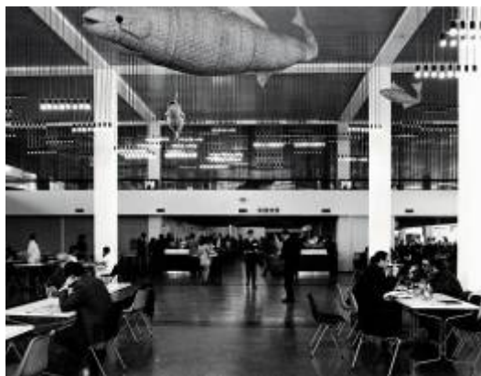
Imagen de archivo. Restaurante del Centro Cultural Metropolitano Gabriela Mistral en 1972.

el primero que, en un país del Tercer Mundo, por voluntad de los propios artistas, acerque las manifestaciones más altas de la plástica contemporánea, a las grandes masas populares. " 2