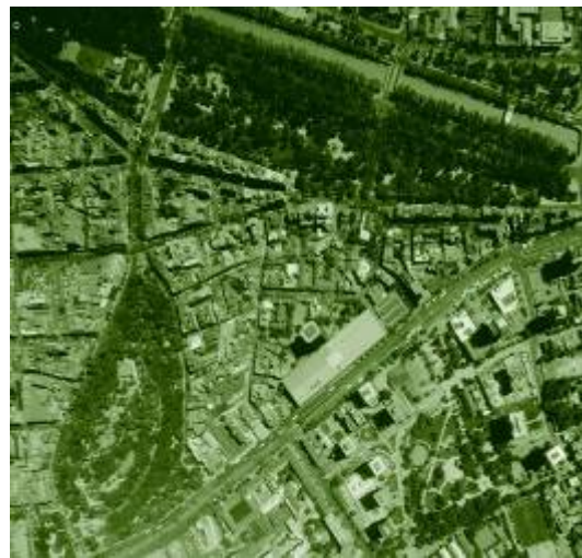
Foto aérea Santiago de Chile 2001. Zona de impacto de los museos Nacional de Bellas Artes (arriba izquierda en la imagen) e Internacional de Arte Moderno y Contemporáneo Gabriela Mistral (al medio abajo, en la imagen) planteado.

La posibilidad de interacción entre los 2 museos recuperará el tejido urbano, recomponiendo la estructura social republicana y generando desarrollo económico que consolidará de esta forma el sector como un modelo urbano para la ciudad en densidad integrada socialmente y sustentable económicamente. Al mismo tiempo, podrá prestar servicios de nivel internacional, posibilitando una influencia directa sobre el deteriorado centro de Santiago.