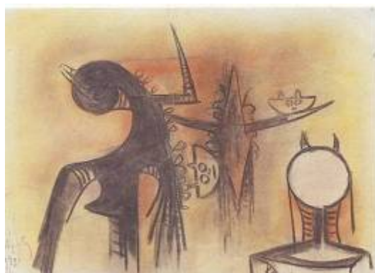
Lam, Wifredo, 1973. S/T, Colección Museo de la Solidaridad Salvador Allende.