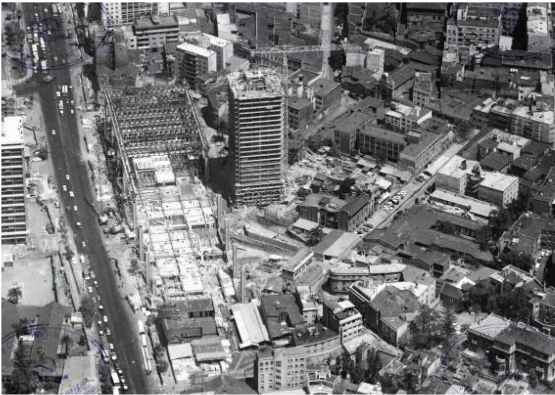
Construcción del edificio de la UNCTAD III. La violenta implantación de la geometría del polígono por sobre la trama del barrio, produjo un descalce, posible de ser remediado a través de la reestructuración y administración de su espacio público.

Esta acción, heredera del tipo de intervención planteado por la vecina Remodelación San Borja, situada frente al edificio, está también influida por el tipo de implantación urbana planteada simultáneamente en la creación del Centro Pompidou de París (Piano y Rogers, 1971). Y al igual que éste último, El Edificio de la UNCTAD III tuvo una intensa utilización como lugar de encuentro ciudadano mientras estuvo abierto.