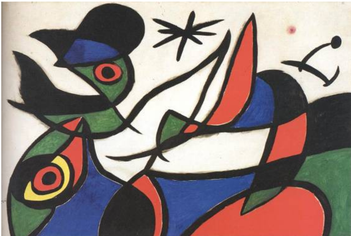
Miró, Joan, 1972. S/T ( El Gallo ).

PROPUESTA DE UNA POLITICA DE ESTADO PARA LA REPUBLICA DE CHILE PARA UN PLAN DE REORDENAMIENTO Y CONSERVACION DEL PATRIMONIO ARTISTICO NACIONAL EN LA CIUDAD DE SANTIAGO Y SU IMPACTO EN EL DESARROLLO.