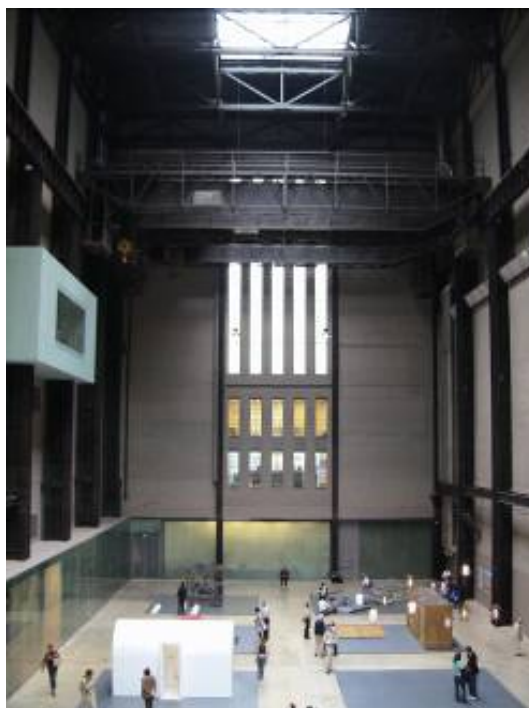
Herzog y De Meuron, 2000. Tate Modern, Londres.

modo los museos son los lugares donde se guarda aquellos objetos que por su condición histórica, científica o artística, presentan un alto valor patrimonial dada la información original que estos contienen y la importancia de ésta para el desarrollo de las generaciones futuras. Así los museos son principalmente cofres cuyo principal objetivo es la adecuada conservación para la posteridad, de estos objetos preciados. El objetivo de esta conservación es que los ciudadanos en sus distintos grados de especialización puedan tomar contacto con la información que estos contienen y puedan acceder a un conocimiento y un debate que