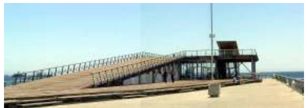
La acción detonante del proyecto sería la apertura del muelle barón ya que se hace prescindible como muelle de carga y se convierte en paseo público

El rol del arquitecto es el de generar proyectos sensibles y con calidad para la ciudad, que respeten el entorno heredado. Actuar como mediador entre las diferentes partes involucradas, de manera de facilitar el diálogo y coordinar las funciones para poder llevar a cabo el proyecto urbano. Gracias a su formación, el arquitecto es capaz de pensar las nuevas áreas urbanas generando proyectos de calidad, de modo de preocuparse por aminorar los problemas de la gente, mediante la administración de recursos ambientales, territoriales y sociales. Sin embargo estas obras no deben tener pretensiones individualistas por sobresalir, deben coordinar efectivamente el factor económico de manera de constituir espacios de relevancia dentro de la ciudad.