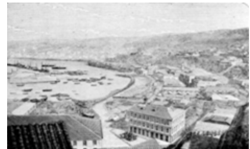
siglo XIX: primer puerto del Pacífico

A todo lo anterior se suma el hecho de tener posibilidad de movilidad entre sus distintos sectores, lo que genera una conectividad vial que junto a las telecomunicaciones permiten a la ciudad cada vez más estar conectada con el resto del mundo.