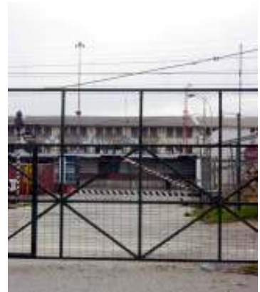
Obsolescencia de infraestructura portuaria

En este sentido el rol del arquitecto es la de mediar entre; agentes públicos, privados y ciudadanos, posibilitando el consenso de todos los actores, de modo de optimizar la toma de decisiones, posibilitar el mejor desarrollo del proyecto urbano y llevarlo a cabo. 1