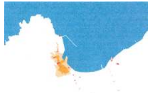
2003: Áreas patrimonio UNESCO