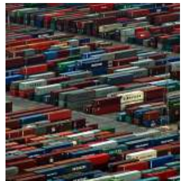
Ya no hay necesidad de mantener los containers en el puerto