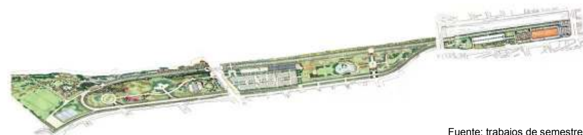
Imagen Parque de los Reyes

La gestión urbana trata principalmente de la tarea de llevar a consenso las diferentes partes que influyen en la realización del proyecto urbano. Para ello se hace necesario tener la claridad y la capacidad de transmitir las ideas principales del proyecto y “venderlo” a los diferentes actores que se pretende que participen de la iniciativa.