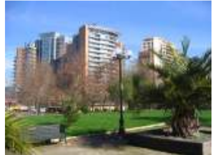
Vista de la oferta inmobiliaria

En particular en el caso del proyecto Parque de los Reyes me parece que el arquitecto tendría que tener la capacidad de prever los problemas de segregación y discontinuidad que producirían los nuevos edificios de vivienda propuesto por las inmobiliarias. En este sentido, lo que se le pide al arquitecto es tomar iniciativa en su participación de los procesos de creación de ciudad, y dejar de ser ese personaje que se sienta detrás de un escritorio con lápiz y papel trazando planes idealistas y utópicos que no reconocen la realidad de la ciudad que pretenden modificar, se le pide tener capacidad de observar, hacer un diagnóstico claro y preciso para posteriormente pasar a proyectar visiones futuras acertadas de acuerdo a las tendencias de desarrollo observadas previamente, y luego tener la capacidad de explicar y demostrar por qué la o las soluciones que propone son necesarias y viables para el desarrollo futuro de la ciudad.