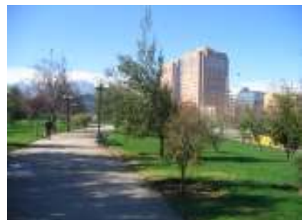
Vista de estación mapocho y Aguas Andinas